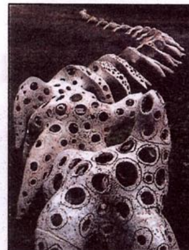
Le roi des serpents.

Bordeaux. Expositions, cinéma, concerts, animeront ce festival dont le point d'orgue sera la fête de la poterie à Sadirac les 13 et 14 juin où plus de 5 000 visiteurs sont attendus. Ateliers de poterie et de Raku, expositions, animations, cuisson médiévale, concert du Jorem, vente à la criée sont quelques uns des grands rendez-vous proposés.