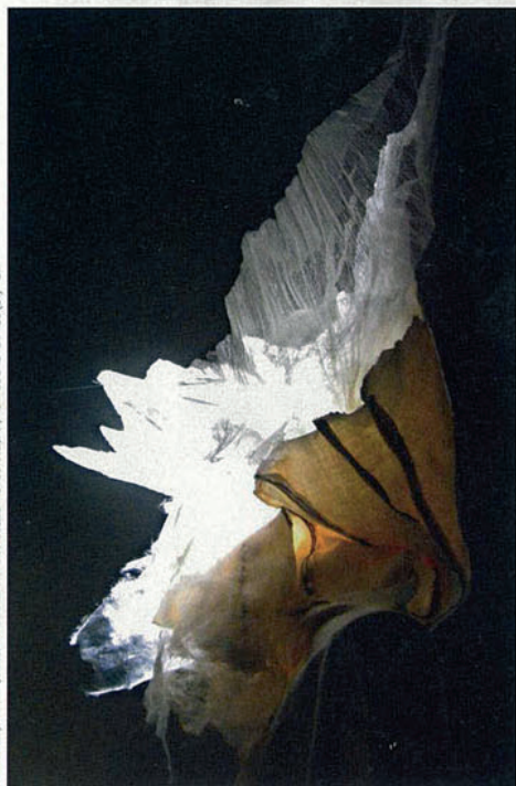
CRÉATION DE JEAN-PAUL LEBLANC DANS LE CADRE DU COLLECTIF LA DÉRÔBÉE, AU JARDIN DE LA BRANDE (24)