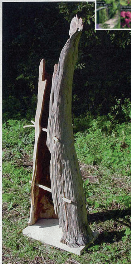
SCULPTURE DE PHILIPPE GIMARD AU JARDIN DE RINADÈS A MONTAGNAC-LA-CREMPSE (33)

Trois jardins se sont alliés pour faire découvrir les trésors cachés en vallée de la Crempse, en limite du Périgord blanc et pourpre. À Fouleix, le bois jardiné et les cabanes de La Brande ont ouvert les festivités en accueillant les installations du collectif d'artistes La Dérôbée. Le jardin de Malrigo, à Saint-Jean-d'Estissac, rassemble des installations d'une quinzaine de céramistes, sculpteurs et plasticiens. Et à Montagnac-la-Crempse, le jardin collectif de « Paradis » allie poésie et installations en châtaignier. À la fois conviviale et originale, cette manifestation organisée par l'association Les Amis de Pol Chabost permet aux visiteurs de découvrir, dans ces « jardins de la biodiversité » et dans les galeries, une vision très conceptuelle et diversifiée du paysage entre art, patrimoine et nature.