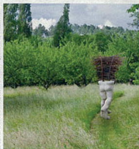
LE BÉRONÉ DE MARGOL, VILLIÈRE-GRAVÈSÈ DE PAYSAN COBERT