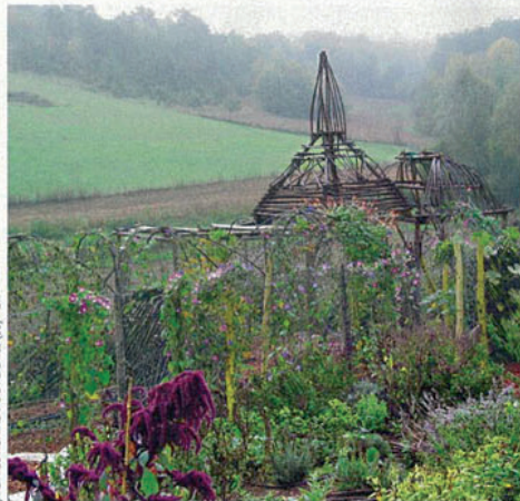
JARDIN DE MONTAGNAC-LA-CREMPSE (33)