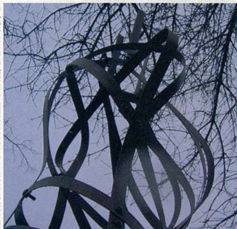
SCULPTURE DE CATHÉRIE LEBLANC DANS LE CADRE DU COLLECTIF LA DÉRÔBÉE, JARDIN DE LA BRANDE (24)