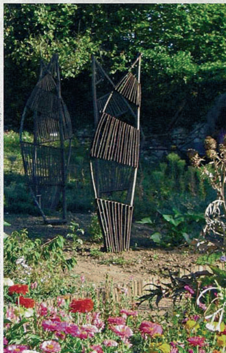
INSTALLATION EN CHÂTAIGNIER DE L'ASSOCIATION POUR LES FRUITS DU JARDIN DE BELLEVÈRE A MONTAGNAC-LA-CREMPSE (33)

www.polchambost.fr www.assobeyleme.org www.jardinsdelabrande.com